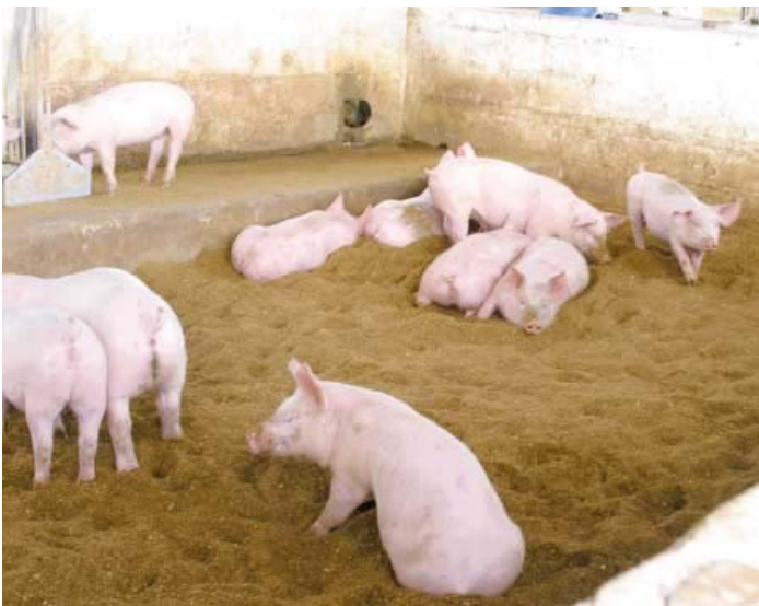
L'élevage de porcs sur une litière épaisse au Brésil

Au sud du Brésil, un certain nombre d'exploitations où les températures sont relativement élevées utilisent des litières à base de coques d'arachide, de balles de riz ou de bois pulvérisé. Souvent, les porcs sont logés dans des bâtiments à pans ouverts munis de rideaux.