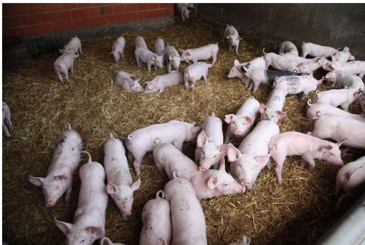
Une ferme française

http://www.europeanfarmersnetwork.org/files/efn/documents/case_studies_1_0.pdf