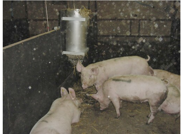
Distributeur de paille

Une étude portant sur un système au caillebotis partiel faisait état d'un distributeur composé d'un tube en métal (hauteur : 77,0 cm ; diamètre : 29,0 cm) équipé d'une corbeille en cote de mailles située en dessous (hauteur : 17,0 cm). Le distributeur était fixé sur la paroi du compartiment, à environ 3,0 m loin de l'avant du compartiment, pour que la corbeille en cote de mailles soit à la hauteur de la tête des porcs. Le distributeur était rempli de paille longue que les porcs pouvaient fouiller et tirer à travers la cote de mailles. Un plateau métallique (57,5 cm x 56,0 cm ; bordure de 4 cm) fixé sur la paroi du compartiment, au niveau du sol, en dessous du distributeur, recueillait la paille qui tombait.