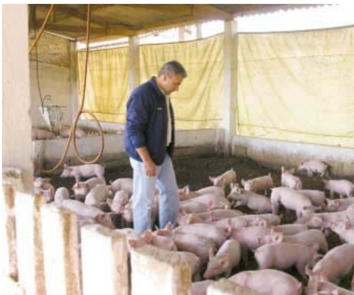
Des porcelets sevrés sur coques d'arachide au Brésil